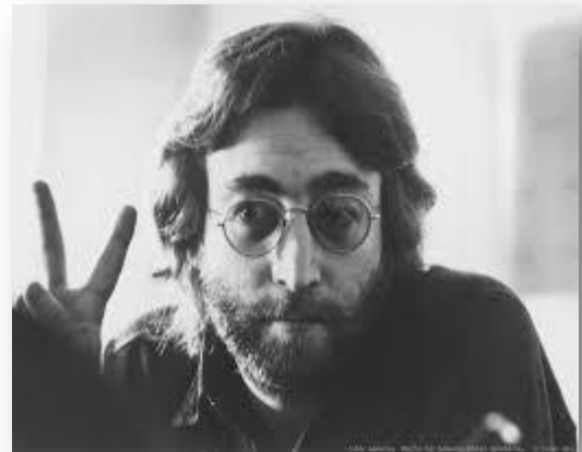
Εικόνα 7. John Lennon

Ο Bob Dylan είχε ένα τρόπο ερμηνείας, μία έκφραση, στίχους, μουσική και συγκεκριμένες πεποιθήσεις που τον έφεραν κατευθείαν στα φώτα της διασημότητας. Μέσα από τα τραγούδια του αναδύονταν η αμφισβήτηση, η άρνηση, η διαμαρτυρία και γι' αυτό το λόγο οι στίχοι του έγιναν και συνθήματα. Παρ' όλα αυτά αρνήθηκε να γίνει η φωνή του κινήματος και γράφει πιο περίπλοκα ρόκ ποιήματα καθώς η ρόκ αποτελεί μουσική διαρκούς αμφισβήτησης. Αν και η δεκαετία του 60' είναι μία εποχή θα λέγαμε πιο άγρια, ο Bob Dylan συνέχισε να γράφει μουσική γυρίζοντας στις ρίζες.