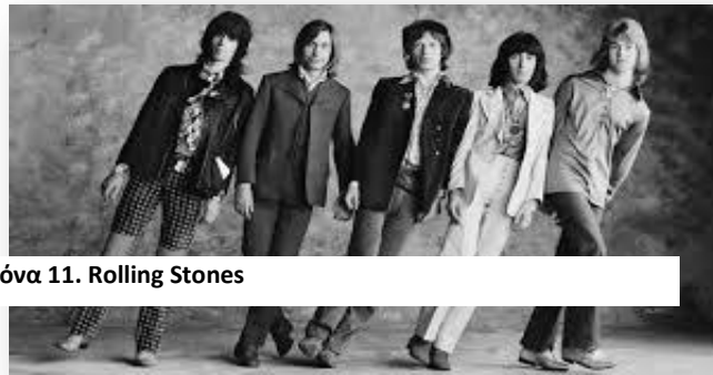
Εικόνα 11. Rolling Stones

'If I look hard enough into the setting sun my love will laugh with me before the morning comes' (=εάν κοιτάξω αρκετά σκληρά μέσα στον ήλιο, η αγάπη μου θα γελάσει μαζί μου μέχρι να έρθει το πρωί ) :Αναφέρεται στην αγαπημένη του στον παράδεισο .