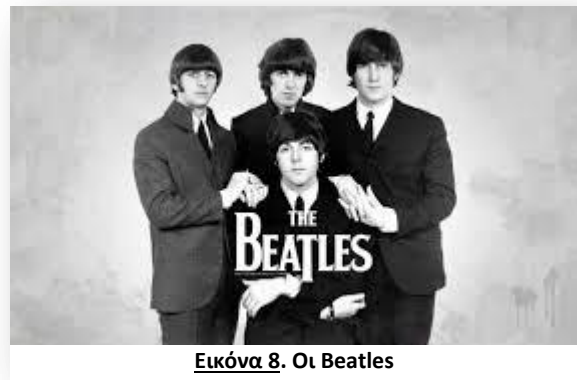
Εικόνα 8. Οι Beatles

Οι Beatles ήταν ένα παγκοσμίου φήμης αγγλικό ροκ συγκρότημα (γνωστό και ως "Σκαθάκια" στην Ελλάδα) από το Λίβερπουλ , αποτελούμενο από τον Τζον Λένον (John Lennon), τον τραγουδιστή Πολ ΜακΚάρτνεϋ , τον Τζορτζ Χάρισον και