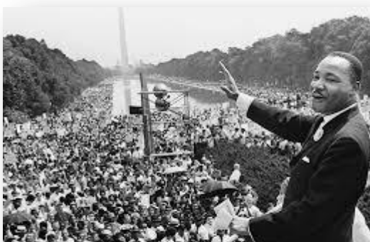
Εικόνα 1. Ο Μάρτιν Λούθερ Κίνγκ στη περίφημη ομιλία του στην Ουάσινγκτον.

Ως προς τις φυλετικές διακρίσεις γνωρίζουμε στην Αμερική τον Martin Luther King.