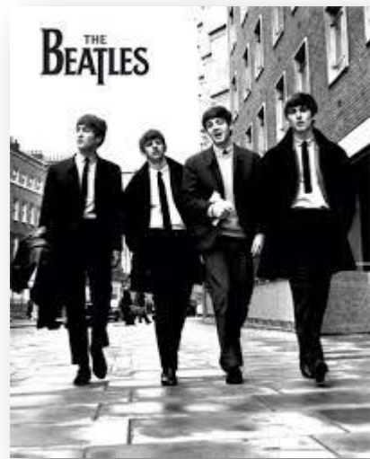
Εικόνα 12. Beatles

ένας γάμος ) ,του ήρθε όλη η συνέχεια του κομματιού και έτσι νότα – νότα και στίχο – στίχο δημιουργήθηκε το κομμάτι.