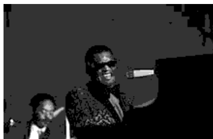
Ο πατέρας της σόουλ Ray Charles στο Αμβούργο το 1971.

Η soul πήρε το όνομά της την δεκαετία του '60 και προέκυψε από τη συγχώνευση γκόσπελ, της R&B της spiritual αλλά και της doo-wop μουσικής. Σύμφωνα με κάποιους, αποτελεί την κοσμική μορφή της μουσικής γκόσπελ. Έφτασε στο απόγειό της κατά τη πενταετία 1965-1970. Γεννήθηκε στις Ηνωμένες πολιτείες, αποτέλεσε αρχικά μουσική των μαύρων στις συναθροίσεις και τις γιορτές τους, αλλά γρήγορα υποστηρίχθηκε από τους λευκούς που εναντιώνονταν έντονα στις στερεοτυπικές αντιλήψεις της κοινωνίας και δεν θεωρούσαν την κουλτούρα ή την μουσική των μαύρων εξευτελιστική. Από τη σόουλ απορρέουν μουσικά ρεύματα όπως η ντίσκο, η ποπ αλλά και η χιπ-χοπ. Δίνεται κυρίως έμφαση στα χορευτικά ακούσματα, ενώ θεωρείται από πολλούς πως πήρε στοιχεία από τζαζ. Η σόουλ είναι ευδιάκριτη από τα χάλκινα πνευστά με σημαντικότερα το σαξόφωνο και την τρομπέτα. Όταν λοιπόν την εν λόγω δεκαετία οι μαύροι προσπαθούν να διεκπεραιώσουν τα δικαιώματά τους, η σόουλ γίνεται η αντιπροσωπευτική τους και υποσκελίζει την μπλουζ. Αν και είχαν λίγα κοινά, η σόουλ δεν άργησε να συνδεθεί με την μουσική ροκ. Πατέρας της μουσικής που ονομάστηκε σόουλ, θεωρείται ο Ray Charles , ενώ οι πιο διάσημοι εκπρόσωποι της είναι οι James Brown , Al Green , Otis Clay , Aretha Franklin κι άλλοι.