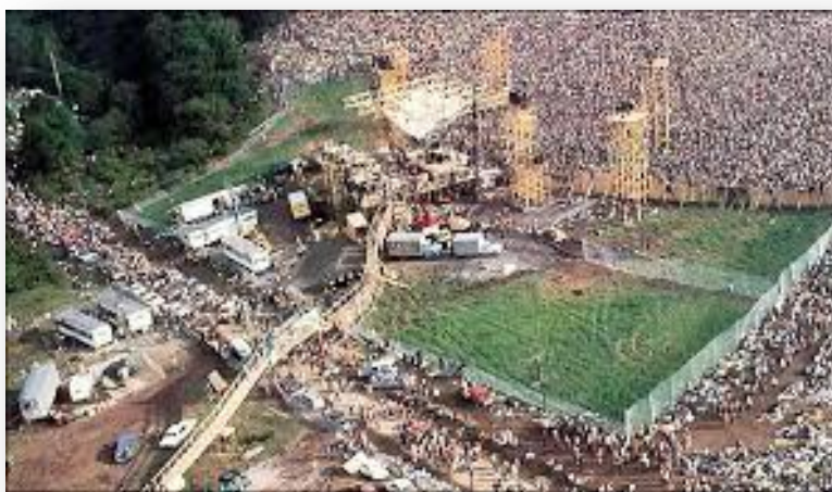
Εικόνα 10. Το πλήθος που περιμένει μπροστά στη σκηνή . .

Παρ' όλες τις προσπάθειες που έγιναν έπειτα για την αναβίωση αυτού του φεστιβάλ, δεν ξαναοργανώθηκε παρά λίγες φορές και όχι με την ίδια επιτυχία όπως το πρώτο. Έχει μείνει όμως ένα από τα πιο γνωστά και δημοφιλή φεστιβάλ του 20 ου αιώνα το οποίο επηρεάζει νέους και μεγάλους μέσα από τα μηνύματα που προσπαθούσε να περάσει ο κόσμος μέσα από τη συμμετοχή του.