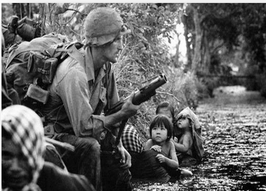
Εικόνα 5. Στρατιώτης την ώρα της σύγκρουσης ενώ οι άμαχοι προσπαθούν να ξεφύγουν

Ο Πόλεμος του Βιετνάμ ήταν η μεγαλύτερη ένοπλη σύγκρουση κατά τη διάρκεια του Ψυχρού πολέμου. Θεωρητικά, η μάχη ήταν μεταξύ του Δημοκρατικού Στρατού του Βιετνάμ (Βόρειο Βιετνάμ) και της Δημοκρατίας του Βιετνάμ (Νότιο Βιετνάμ). Στη πραγματικότητα όμως, ήταν ο πόλεμος μέσω αντιπροσώπων μεταξύ των Η.Π.Α. και της τότε Ε.Σ.Σ.Δ. Η Αμερική είχε ήδη επέμβει με στρατιωτική δύναμη πιο πριν αλλά το 1963 κατέφθασαν