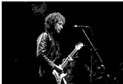
Ο Robert Zimmerman (Bob Dylan) στο Τορόντο το 1980.

Το μουσικό αγγλικό συγκρότημα The Beatles , κατά διάρκεια της περιόδους τους, στις Η.Π.Α.