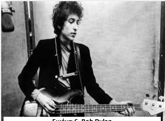
Εικόνα 6. Bob Dylan

Δύο εξέχουσες προσωπικότητες της παγκόσμιας μουσικής είναι ο Bob Dylan και ο John Lennon, δύο μουσικοί που χαρακτήριζαν την έννοια της αμφισβήτησης εκείνης της εποχής.