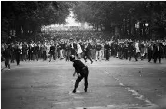
Εικόνα 2. Στιγμιότυπο από τα επεισόδια στο Παρίσι

Στη σημερινή εποχή, δεν υπάρχει καμία διάκριση μεταξύ λευκών και εγχρώμων πράγμα που αποδεικνύεται σε όλους του τομείς, επαγγελματικούς, καλλιτεχνικούς, θρησκευτικούς και πολιτικούς. Ο καθένας έχει το δικαίωμα να εργαστεί να διασκεδάσει να ζήσει με τις δικές του παραμέτρους χωρίς να κριθεί. Ζωντανό παράδειγμα το 2007 όταν εκλέχθηκε ο πρώτος μαύρος πρόεδρος των Η.Π.Α Μπάρακ Ομπάμα.