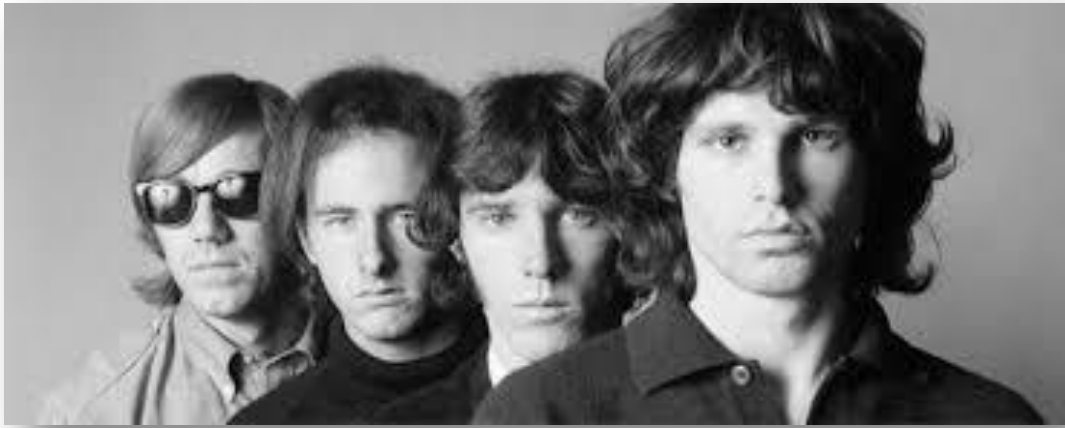
Εικόνα 13. The Doors