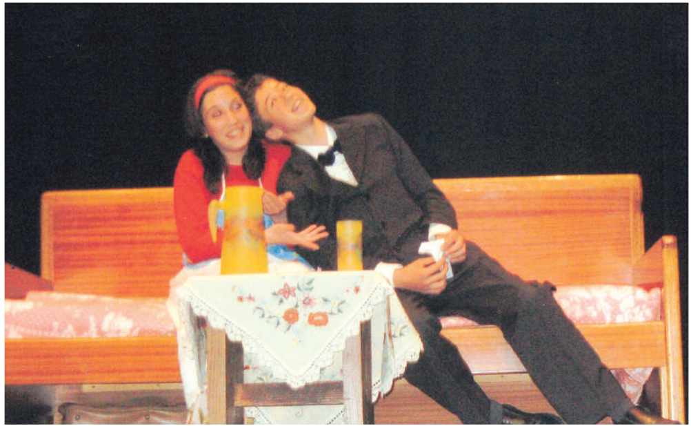
“Πρόταση γάμου” του Α. Τσέχωφ