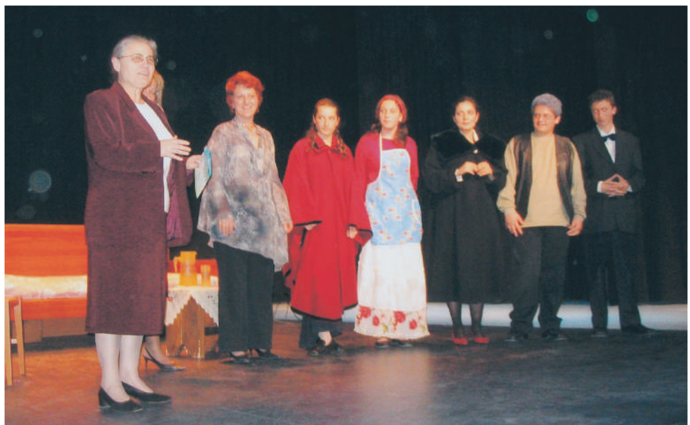
Η Θεατρική Ομάδα